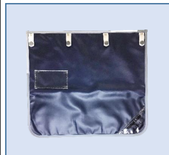
ワイドマジックベルト式スカート マジックベルト式スカート