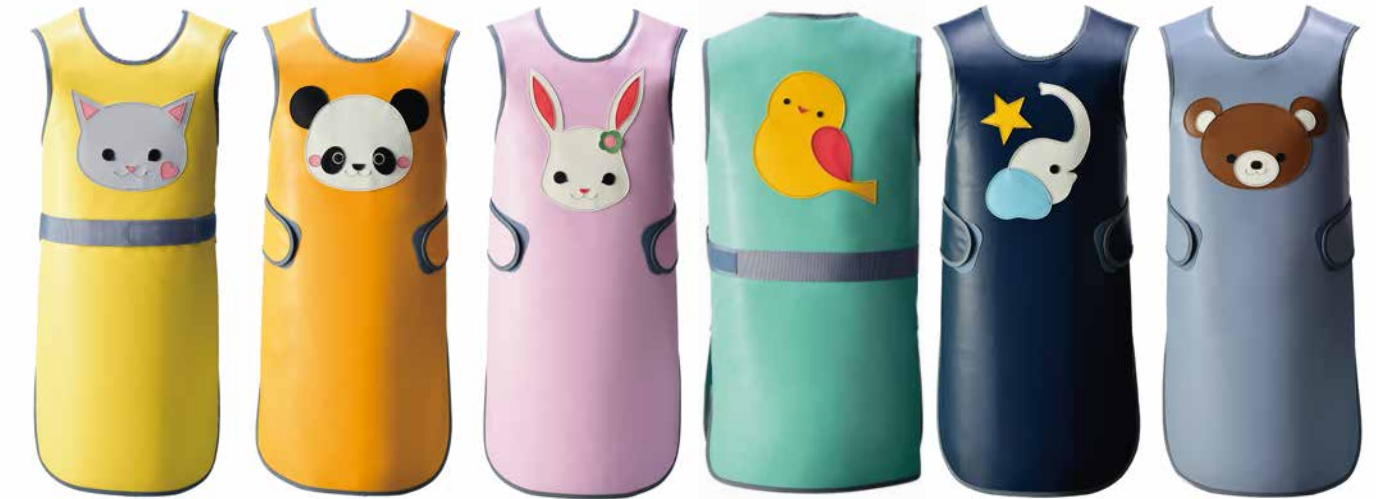
#10 ねこ(A) #11 ぱんだ(B) #6 うさぎ(B) #9 とり(A) #8 ぞう(B) #7 くま(A)