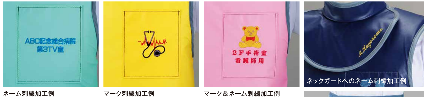
ネーム刺繍加工例 マーク刺繍加工例 マーク&ネーム刺繍加工例

エプロン、コート、ハーフコートへの刺繍はポケットに入ります。 シンプラー、巻スカートにはポケットを付けて刺繍加工します。ネックガードへはネーム刺繍のみ承ります。 刺繍の位置と大きさは、写真の例を基本としています。特別なご希望は図示によってご相談ください。